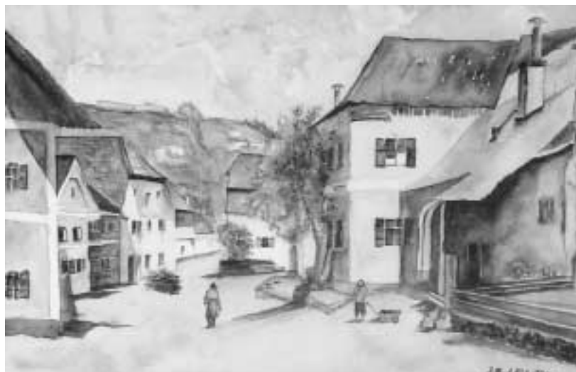
Zeichnung: J. B. Lell

Josef Hartung, Seniorenbeauftragter 0176/63 065 310