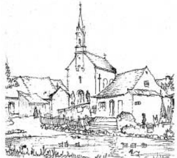
Holzheim a. Forst Die alte Agidiuskirche (1930)

Es konnte ein Betrag von 450,40 EURO an den Volksbund Deutsche Kriegsgräberfürsorge e.V. in Regensburg überwiesen werden.