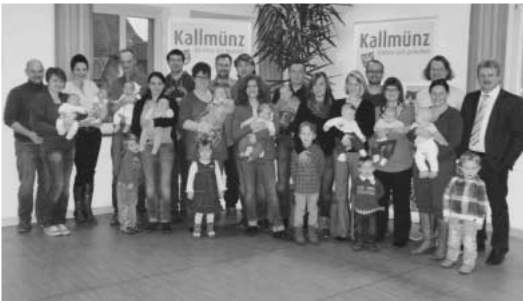
Erster Bürgermeister Ulrich Brey zusammen mit den jungen Kallmünzer Familien und deren Nachwuchs.

diese Nachrichten sehr erfreut. Als kleines Erinnerungsgeschenk wurde den jungen Familien ein Badetuch mit der Aufschrift „Willkommen im Markt Kallmünz“ überreicht. Alles Gute für die Zukunft!